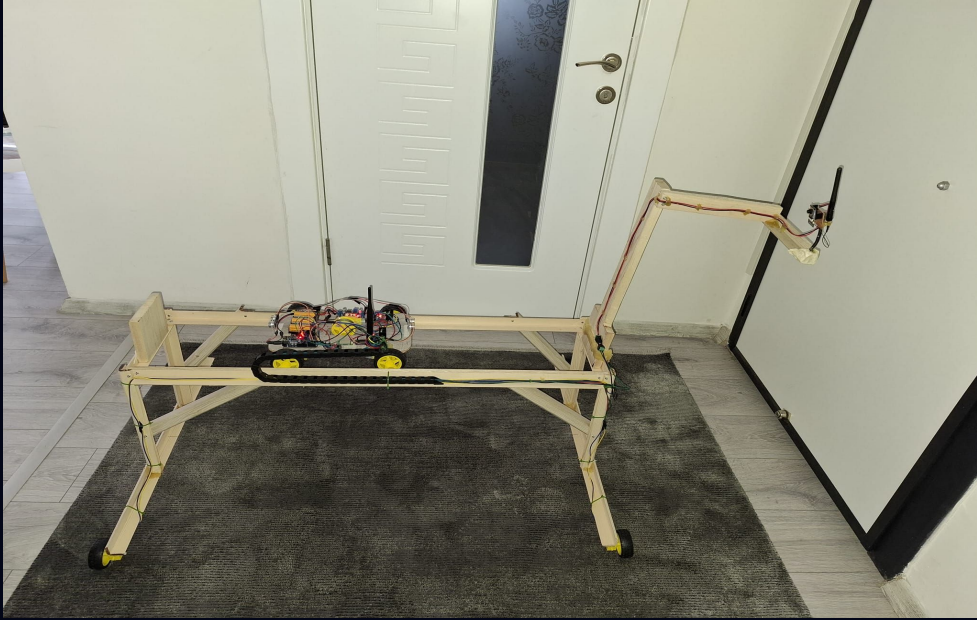
Portal Vinç Prototipi